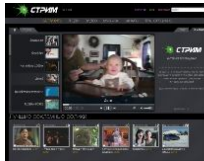
• Вещание на Интернет портале